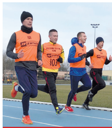
Podczas egzaminów w Betchatowie pogoda dopisywała.