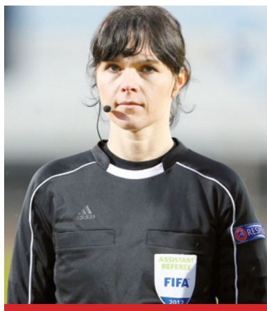
Plaketkę międzynarodowej asystentki nosiła przez 18 lat.

do grupy sędzi międzynarodowych sprawiły, że została „specjalistką od bycia w linii spalonego”.