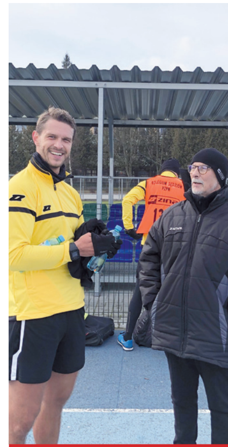
Uśmiech i radość po zaliczonych biegach.