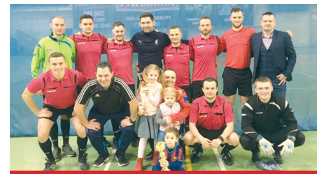
Zwycięzcy turnieju o Puchar Przewodniczącego KS wspólnie ze swoimi najwierniejszymi kibicami.