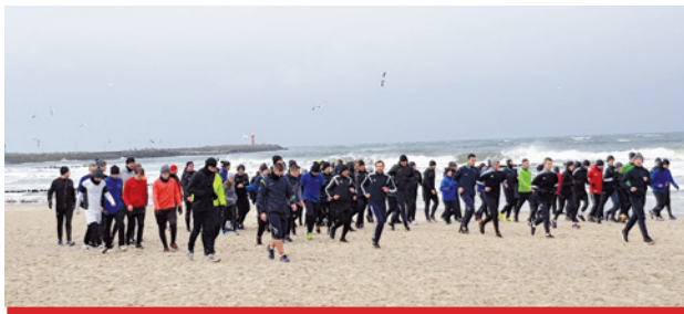
Zgrupowanie w Kołobrzegu to już tradycja. W styczniu odbyła się jego 10. edycja.