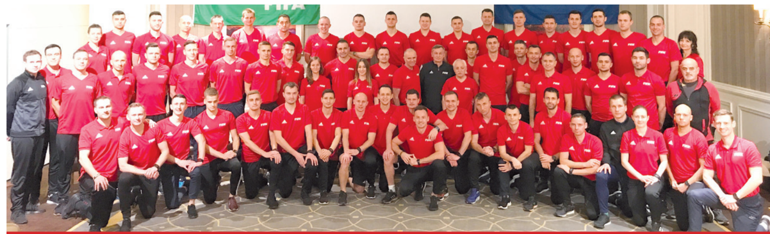
Grupowe zdjęcie uczestników tureckiego obozu.