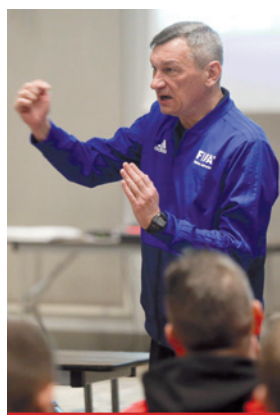
Nasi sędziowie ponownie gościli haryzmatycznego Walentina Ivanowa.

piąc się w basenie lub wygrzewając się w hotelowych saunach. Dzień najczęściej kończyliśmy zajęciami teoretycznymi.