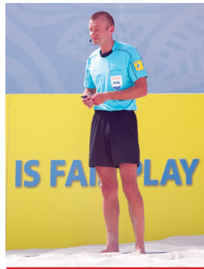
Łukasz Ostrowski należy do światowej czołówki sędziów beach soccera.