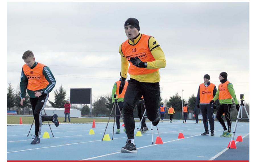
Kandydaci na szczebel centralny w czasie biegów krótkich.