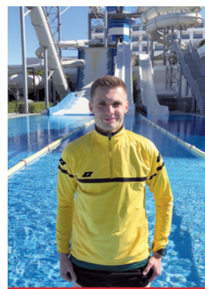
Autor niniejszej relacji, a w tle widoczny jeden z wielu atutów hotelu w Belek.