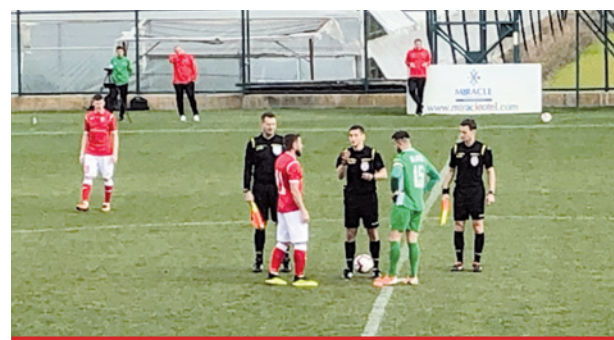
Nasz sędziowski zespół za chwilę rozpocznie kolejny sparingowy mecz w czasie obozu.