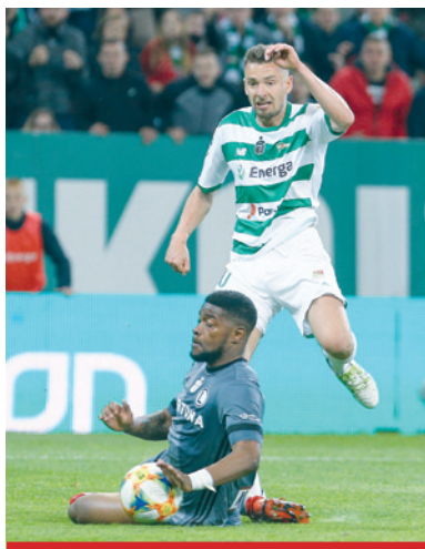
Jeżeli powodem upadku przeciwnika była walka o piłkę, np. wślizgiem, to kontakt jego ręki z piłką nie będzie uznany za przewinienie.

Sędzia może uznać, że zawodnik na pozycji spalonej, biegnąc w kierunku obrońcy jednoznacznie wpływał na możliwość zagrania przez niego piłki, co oznacza uznanie zawodnika na pozycji spalonej za spalonego. Może to np. mieć miejsce gdy zawodnik z pozycji spalonej biegnie na wprost obrońcy przyjmującego piłkę.