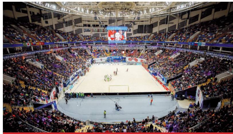
Moskiewska Megasport Arena robi wrażenie. Finał oglądało 8 tys. kibiców.

S tolica Rosji była jednocześnie stolicą beach soccera. Zawody rozegrano w dniach 12-16 lutego br. Mundialito de Clubes ma bardzo bogatą historię. Rozgrywany jest w zasadzie od początku istnienia piłki plażowej. Potocznie mówi się o nim, że jest odpowiednikiem Ligi Mistrzów, ale na piasku.