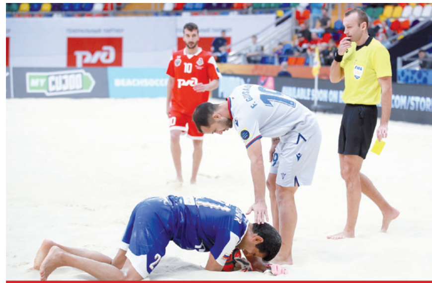
Ostrowski należy do konsekwentnych i wymagających arbitrow.