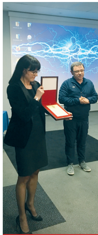
Kinga Seniuk-Mikulska zakończyła swoją piękną karierę.