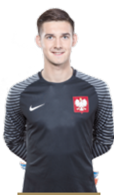
Radostaw MAJECKI 16.11.1999 85/191 Legia Warszawa Bramkarz