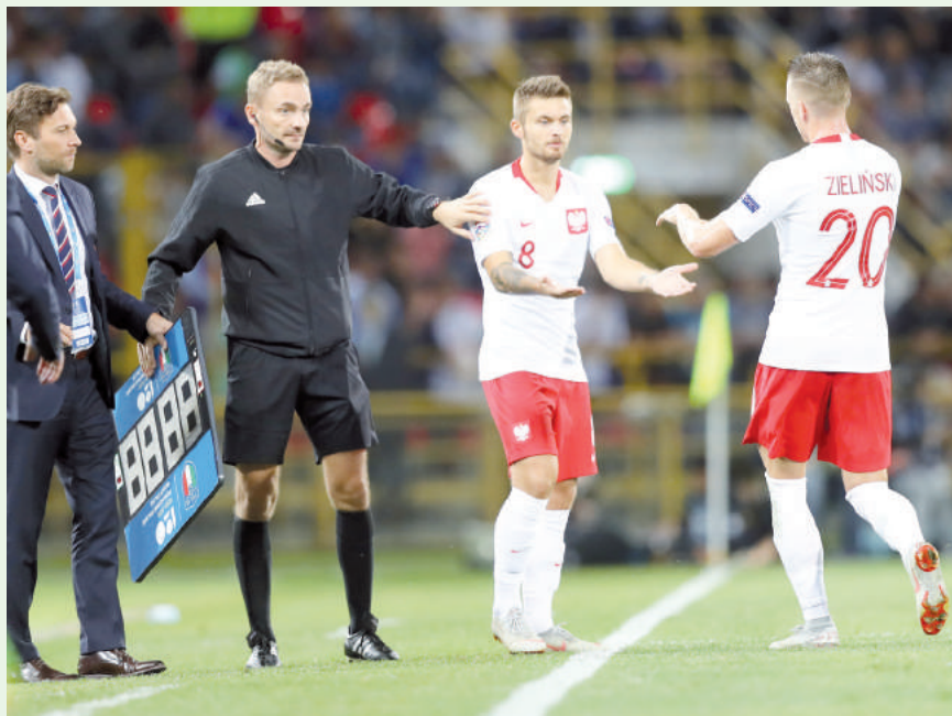
Organizatorzy danych rozgrywek mogą wprowadzić do regulaminu możliwość czwartej wymiany zawodników w dogrywce.

Zawodnik, zawodnik rezerwowy lub zawodnik wymieniony, który wejdzie w SW zostanie napomniany; osoba towarzysząca drużynie, która wejdzie w SW otrzyma publiczne, oficjalne ostrzeżenie (lub napomnienie tam, gdzie żółte kartki stosowane są wobec osób towarzyszących drużynie).