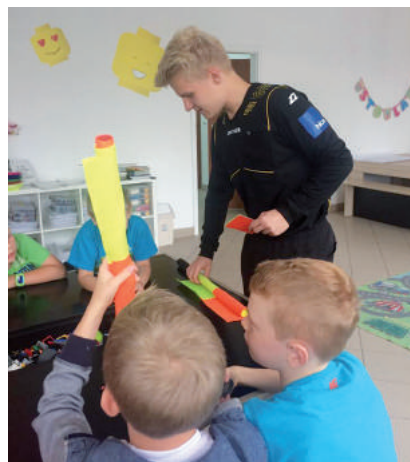
Przedszkolaki z Lublina mogły się dowiedzieć na czym polega praca sędziów.

Niewykluczone, że w przyszłości lubelscy sędziowie będą częściej zaglądali do przedszkoli, szkół czy na uczelnie. W ubiegłym roku w czasie naboru na kurs prowadzone były zajęcia w szkołach średnich. Czynniki arbitrzy mówili o tym dlaczego warto zapisać się na kurs, jak wygląda sędziowanie „od kuchni” oraz rozwiewali wątpliwości dotyczące Przepisów Gry. - To dla nas ważne inicjatywy. Zwłaszcza, że wśród zadań i celów jakie przed sobą stawiamy