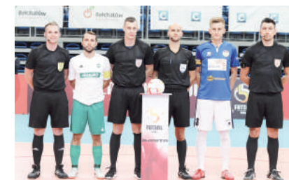
Mecz o Superpuchar Rekord Bielsko-Biała - MOKS Słoneczny Stok poprowadził polsko-czeski zespół sędziowski.

- Dla nas to ważna sprawa, bo Polacy mają dobrą opinię w Europie. Polscy sędziowie zrobili w ostatnich latach wielkie postępy i o tym się mówi. Macie bardzo profesjonalnie prowadzone szkolenia, warsztaty, treningi i dysponujecie dobrym wypo-