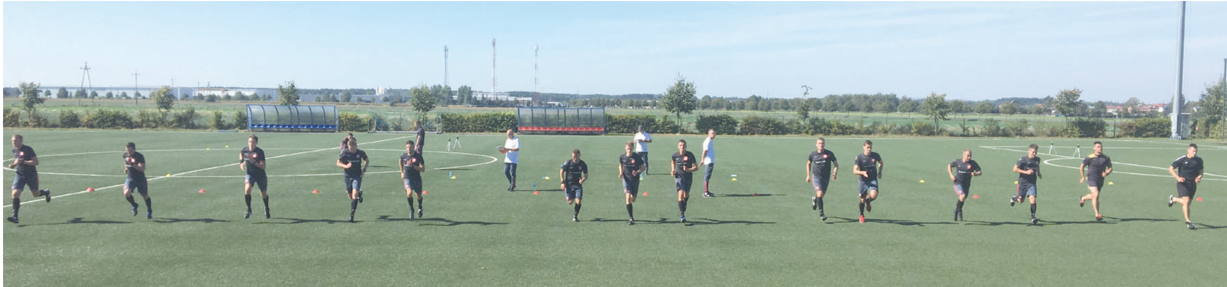
W Kleszczowie warunki do pracy były bardzo dobre.