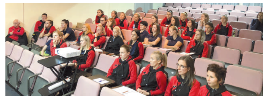
Uczestniczki pierwszego, historycznego zgrupowania kobiet w Spale.