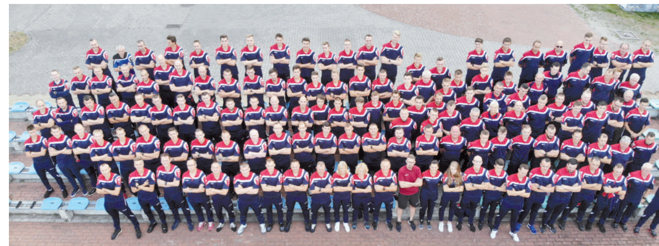
Wszyscy uczestnicy wrześniowego zgrupowania KS Zachodniopomorskiego ZPN.