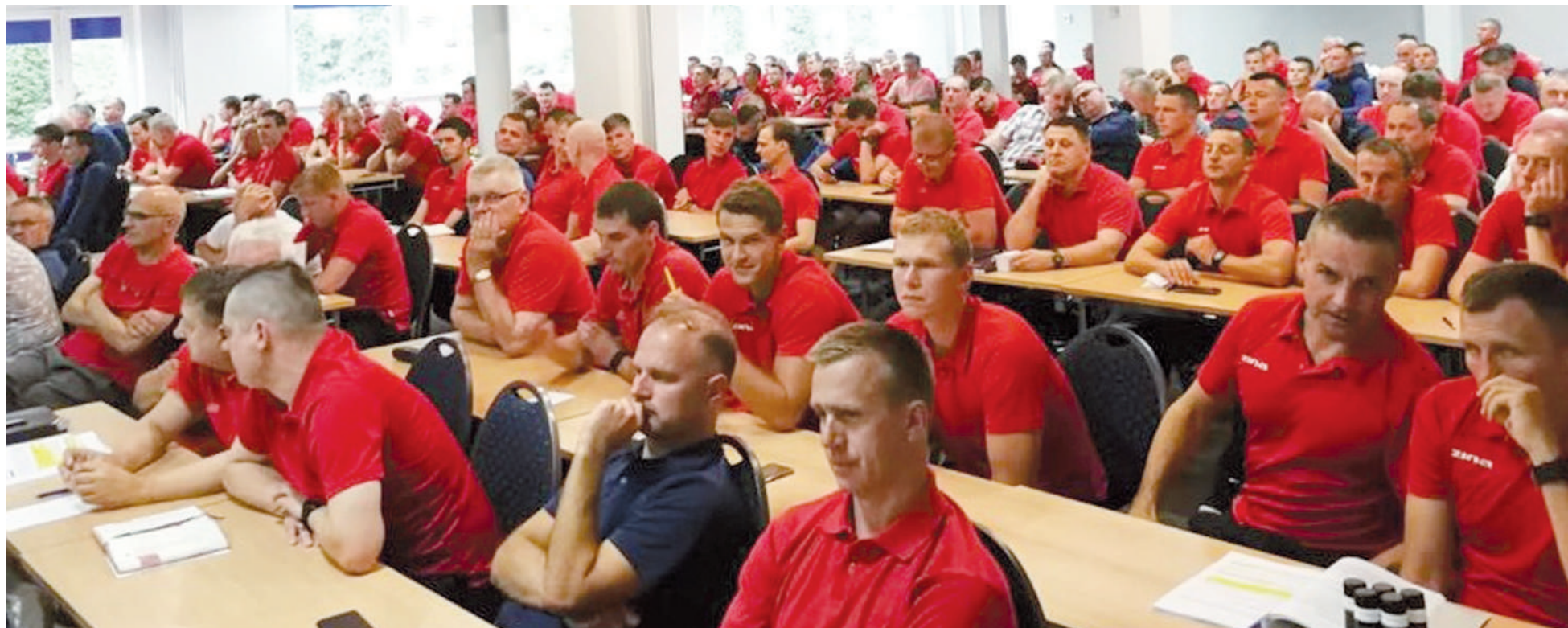
Obserwatorzy i sędziowie podczas wykładów Centralnej Komisji Szkoleniowej.

Wszystkie kursy letniej sesji bazowały na tych samych tematach szkoleniowych. Tradycyjnie na rozpoczęcie każdego zgrupowania przybliżone zostały najnowsze zmiany w Prze-