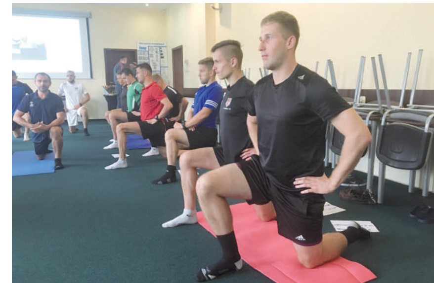
Podczas CORE zwracano uwagę na odpowiednie przygotowanie mięśni.