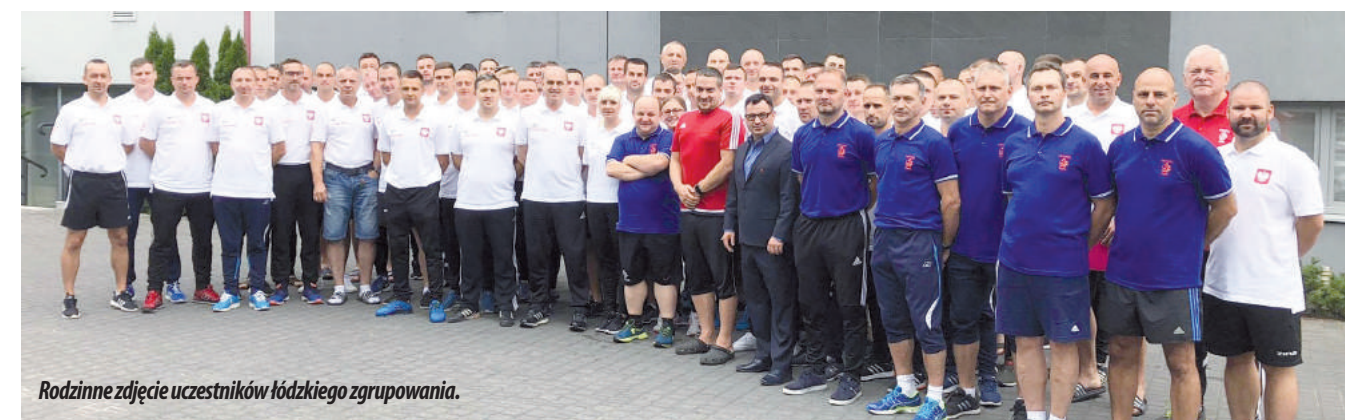
Rodzinne zdjęcie uczestników łódzkiego zgrupowania.