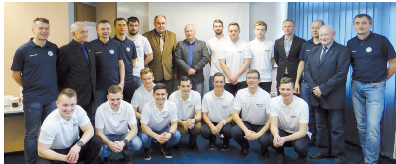
Uczestnicy i opiekunowie programu CORE na Śląsku, a także członkowie Prezydium KS Śl. ZPN.