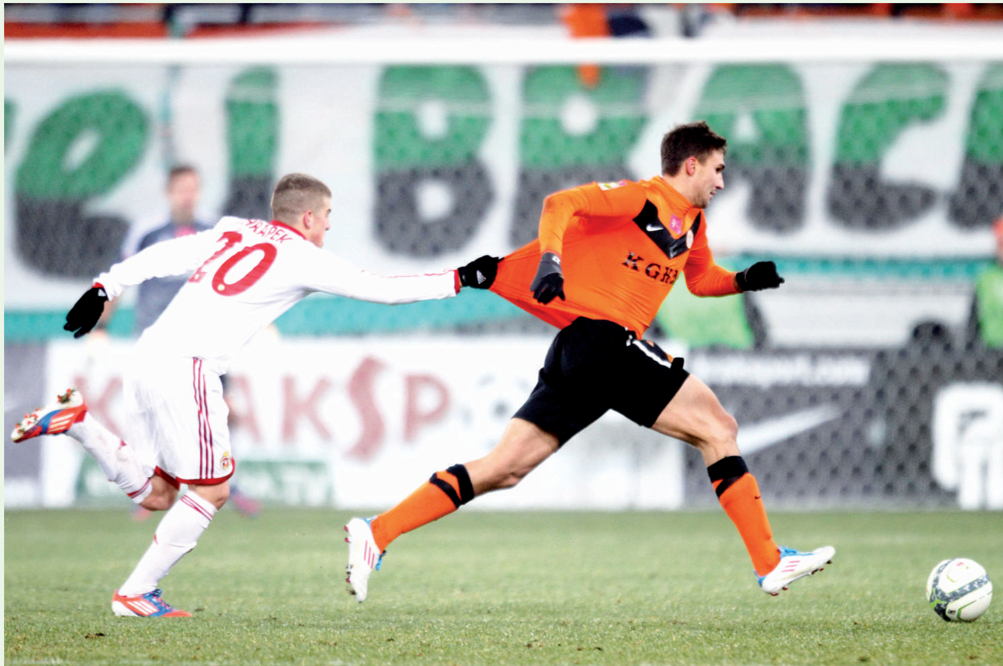
Ostentacyjne trzymanie przeciwnika to podręcznikowy przykład LOR.

Zostaje wreszcie kwestia „drugiej żółtej” – jak tutaj rozstrzygać dylemat, czy to już przewinienie, które de facto zdekompletuje drużynę? O ile to rzeczywiście sytuacja z pogranicza (czyli sędzia jest przekonany prawie na 100%, że to LOR), nie stosujemy taryfy ulgowej. Skoro sięgający po taki faul zawodnik nie miał dylematu, że może go to kosztować wykluczenie, to dlaczego teraz sędzia ma go na siłę usprawiedliwiać? Właśnie po to są wskazówki i podpowiedzi.