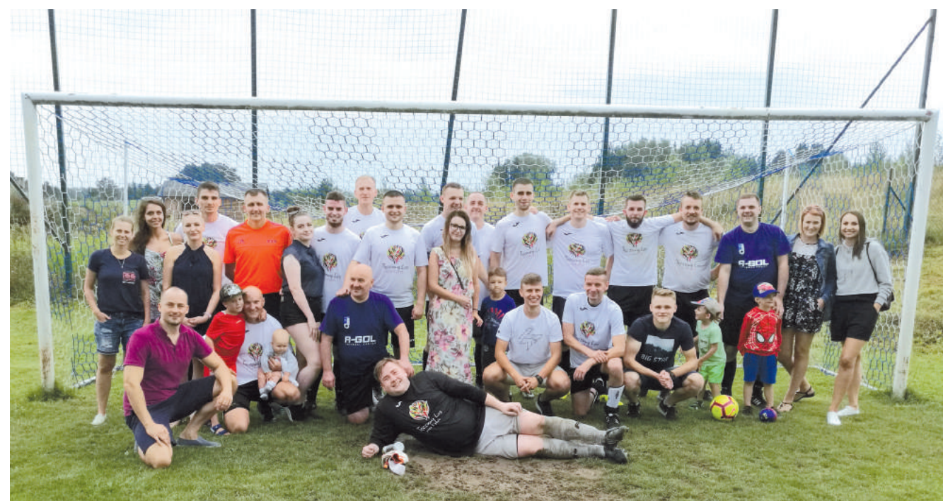
To był krótka, ale ciekawa przygoda sędziów z Warmii i Mazur w Pucharze Polski.