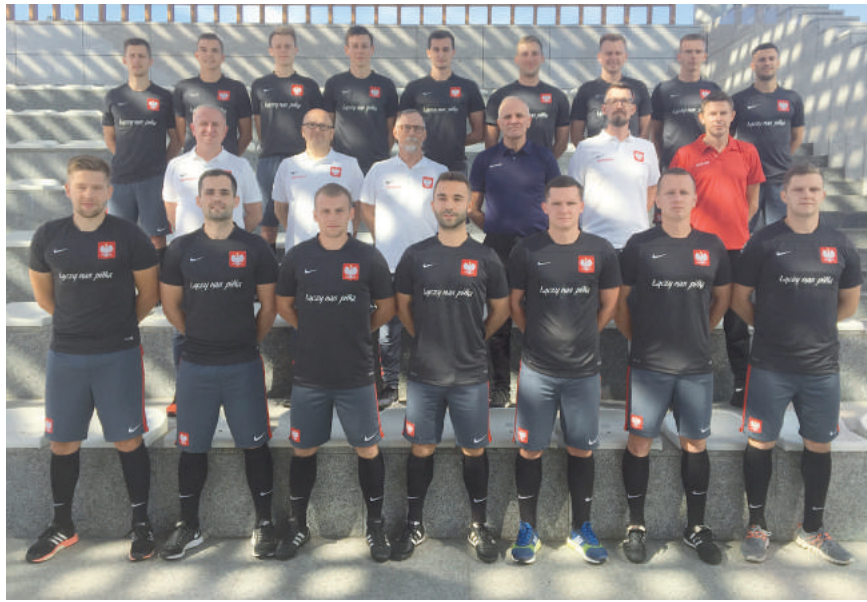
Wspólne zdjęcie uczestników CORE 6 razem z kadrą szkoleniową.