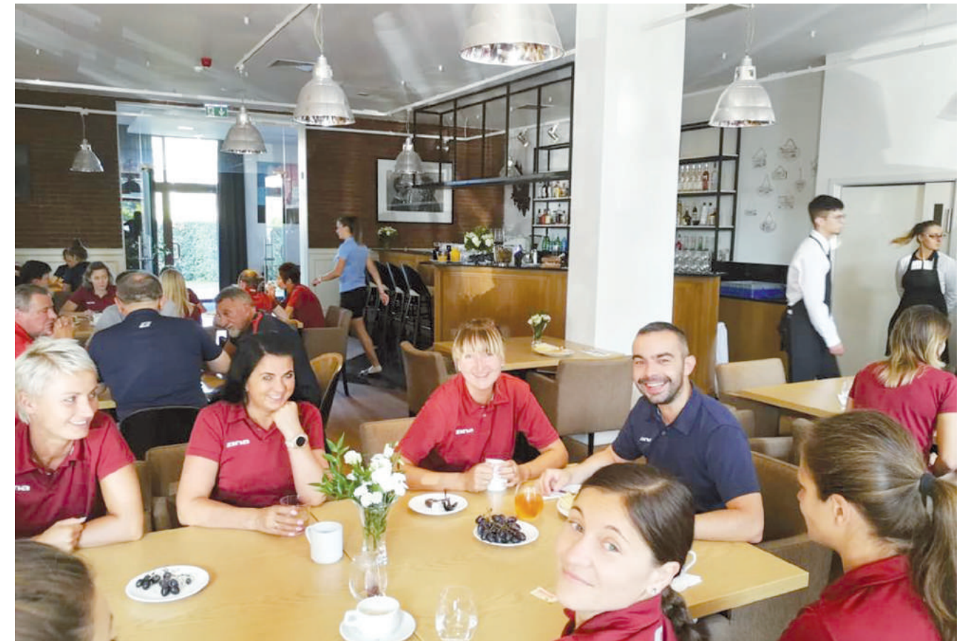
Czas na herbatę i rozmowę w miłym towarzystwie.

Przepisów i dostosowywania ich do oczekiwań świata piłkarskiego. Taką zmianą jest m.in. możliwość wprowadzenia przez organizatora rozgrywek dodatkowej wymiany podczas dogrywki, będącej efektem dwuletniego eksperymentu, który zakończył się powodzeniem. Wprowadzono również kolejne elementy dotyczące zasad i wa-