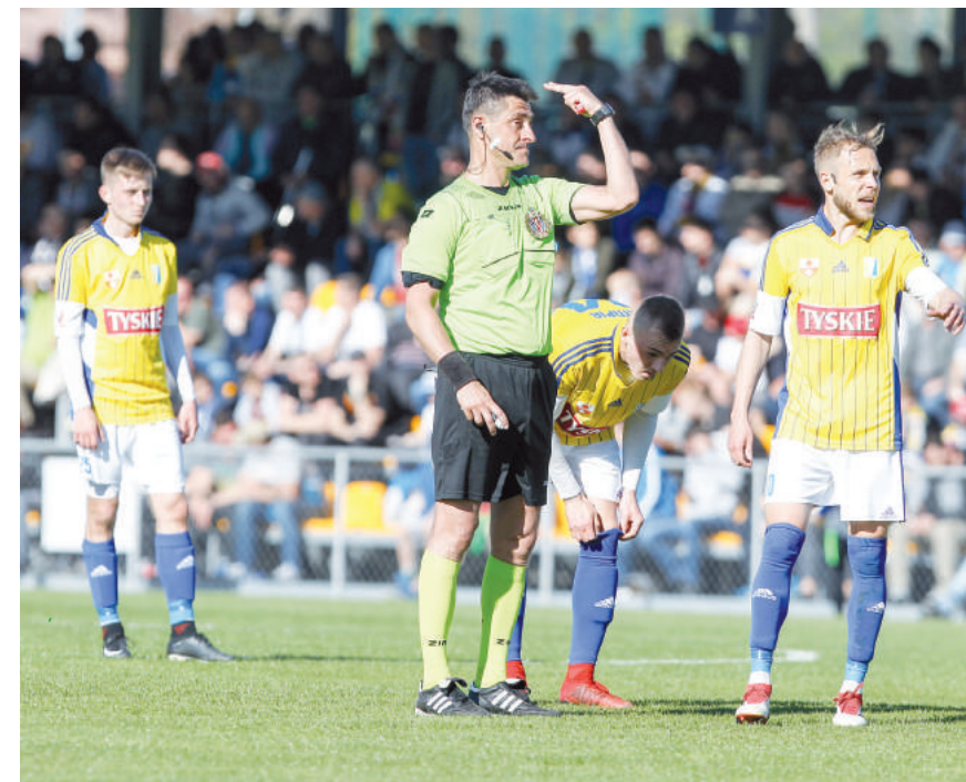
Z zawodu jest strażakiem. Kurs i szkolenia, które przeszedł, przydały się w najmniej oczekiwanym momencie, czyli podczas meczu ligowego w Elblągu.