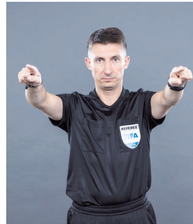
Charakterystyczny gest monitora na stałe wpisał się w piłkę nożną.

„Niech żyje VAR!” – na zakończenie walki w grupie B. Hiszpański dziennik Marca