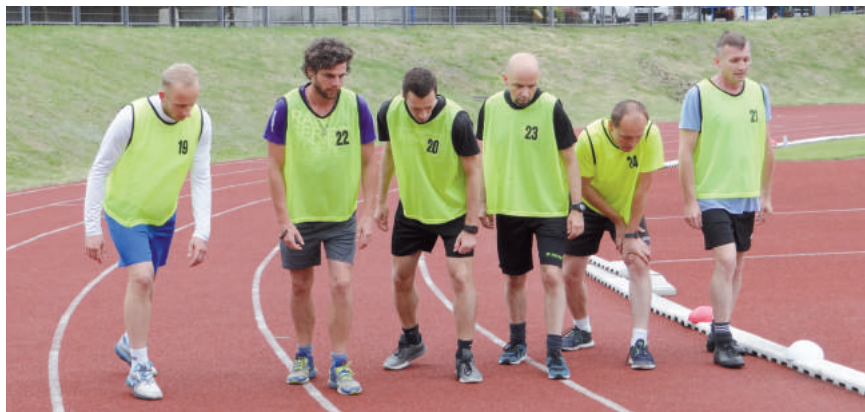
Sędziowie tuż przed startem podczas egzaminów w czerwcu br.