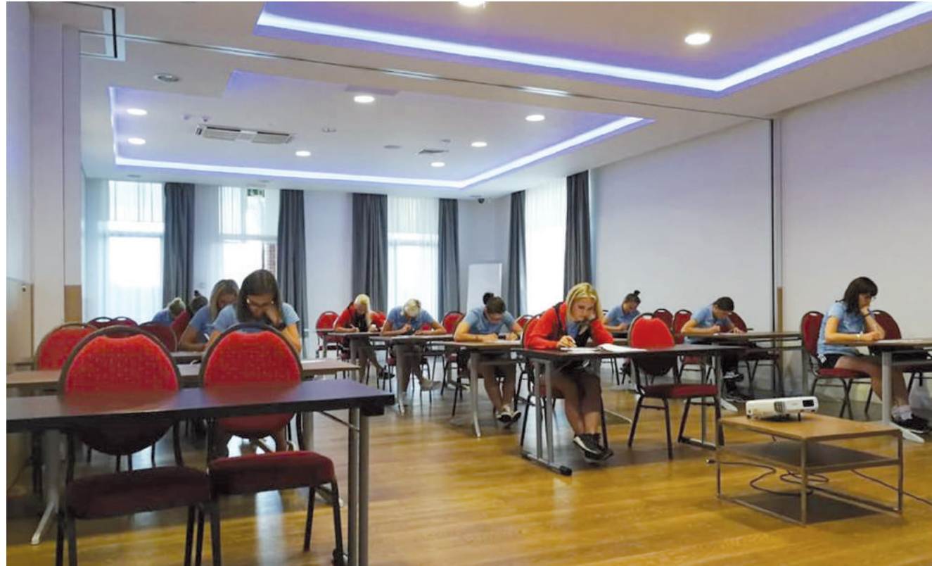
Skupienie sędziów w czasie egzaminu teoretycznego.

Krótką przerwą między sezonami zwykle nie pozwala sędziom na długi odpoczynek. Tego lata było inaczej. LOTTO Ekstraklasa zakończyła swoje rozgrywki już w maju, a I i II liga na początku czerwca. Wszystko przez mistrzostwa w Rosji.