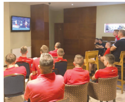
Wspólna integracja asystentów podczas meczu Ligi Narodów Włochy - Polska.