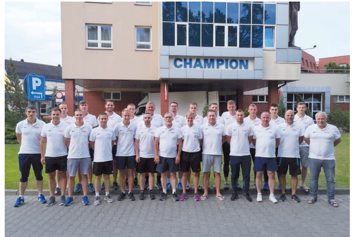
Pamiątkowe zdjęcie na zakończenie CORE 5.