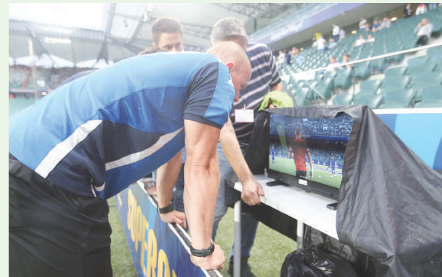
W Przepisach Gry znalazł się rozbudowany zapis dotyczący wykorzystania systemu VAR.

WYJAŚNIENIE: Wskazówki te mają na celu pomoc organizatorom rozgrywek, związkom narodowym, konfederacjom i FIFA w podejmowaniu decyzji co może być umieszczane na wyposażeniu zawodników.