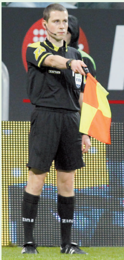
Oceniając spalonego należy brać pod uwagę pierwszy moment kontaktu z piłką przy jej zagraniu lub dotknięciu.

WYJAŚNIENIE: Bramkarze często nieskutecznie próbują złapać/trzymać/zatrzymać lub „sparować” piłkę, ale jako że jest to „celowe” dotknięcie piłki ręką/rękami, którym technicznie kontrolowali piłkę, to wobec powyższego nie mogą jej złapać i podnieść. Nie był to zamysł tego przepisu i nie jest w ten sposób stosowany, w związku