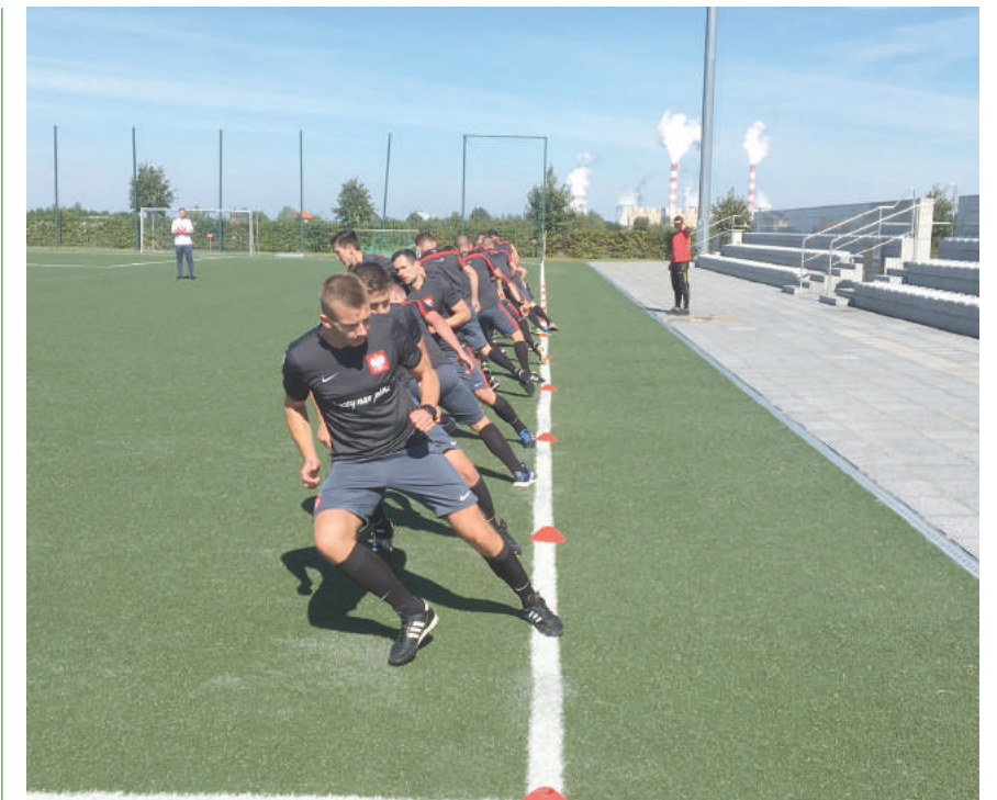
Sędziowie podczas egzaminu sprawnościowego.

Plan jest bardzo rozbudowany. CORE 6 ma dwie części. Pierwszy zjazd odbył się 12-17 września br. w Kleszczowie (woj. łódzkie). Drugie spotkanie przewidziane jest na maj 2019 r. Osią kursu jest sędziowanie. Podczas całej edycji arbitři poprowadzą 16 meczów (III liga, IV liga i CLJ), po 8 meczów w rundzie. Każdy sędzia dostaje swoją szansę „na środku”, a pozostali dostają szansę asystentami lub technicznymi. Każdy mecz jest obserwowany przez instruktorów i obserwatorów. Następnie mecze są dogłębnie analizowane i omawiane. Wnikliwa obserwacja młodych kolegów dotyczy nie tylko samych 90 minut na boisku, ale wielu czynności towarzyszących meczowi. Często nie zdają sobie sprawy, ile rzeczy ma wpływ na ich dany występ albo sposób rozwoju sędziowskiej przygody. Omawianie meczów zajmuje na każdym kursie dwa dni – inaczej niż w zwykłych warunkach ligowych, jest czas, by spokojnie i wnikliwie zająć się każdym detalem. A mając na każdym meczu obserwatora, instruktora i kamerę oraz później 20 osób na sali, żaden szczegół nie ucieknie.