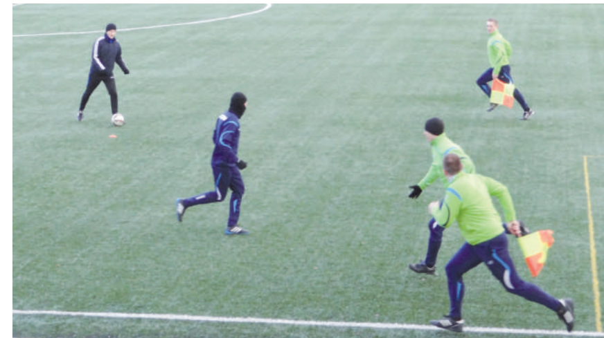
Wojewódzka Grupa Asystentów podczas sprawdzianów, czyli tzw. mijanek.

Sam ranking podokręgów przygotowano w podobny sposób jak ranking klubów UEFA. Wyliczany jest z trzech kategorii opisujących ich potencjał: łączna liczba sędziów, kwota opłaconych li-