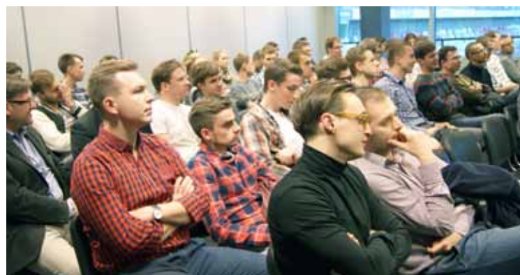
Kuźnia kadr Małopolskiego KS?