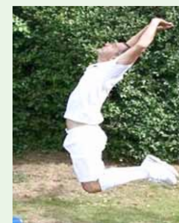
Tak wygląda sekwencja ruchów symulującego zawodnika

najpierw kierunku rzutu, a dopiero później rodzaj. Podczas całego zarządzania takimi sytuacjami sędziowie powinni również mieć na uwadze „ochronę” symulującego zawodnika, ze względu na chęć odwetu ze strony przeciwnika.