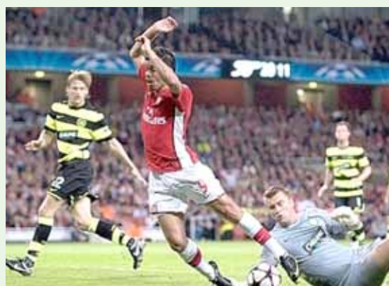
Fot. 1 Uwagę zwraca ułożenie rąk symulanta