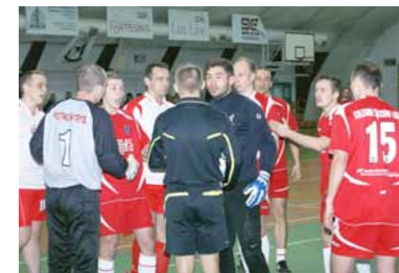
Niby to turniej towarzyski, ale emocji nie brakowało!