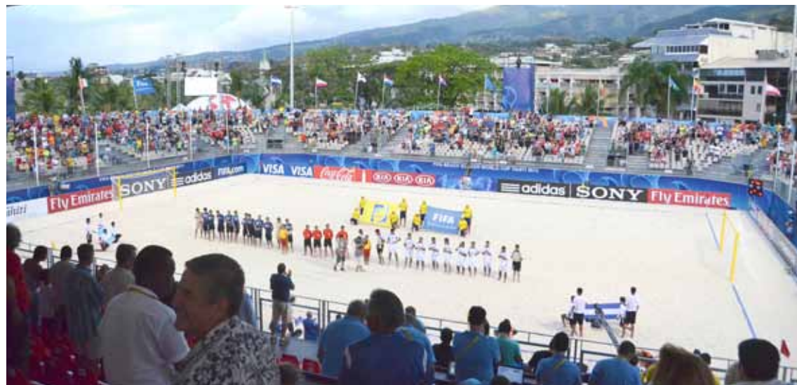
Główna arena tahitańskiego mundialu. Atmosfera była gorąca, dosłownie i w przenośni...