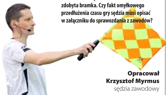
Opracował Krzysztof Myrmus sędzia zawodowy

30 Sędzia omyłkowo przedłużył czas gry drugiej połowy o 10 minut. W tym czasie udzielił dwa napomnienia oraz została zdobyta bramka. Czy fakt omyłkowego przedłużenia czasu gry sędzia musi opisać w załączniku do sprawozdania z zawodów?