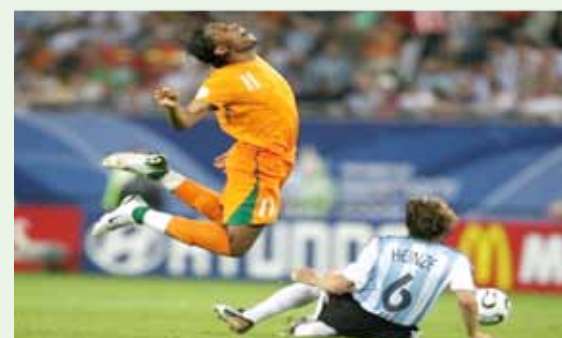
Fot. 2 Symulanta zdradza nienaturalne ułożenie ciała