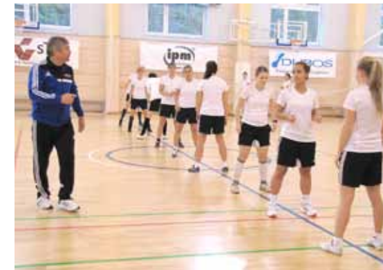
Trening praktyczny na sali