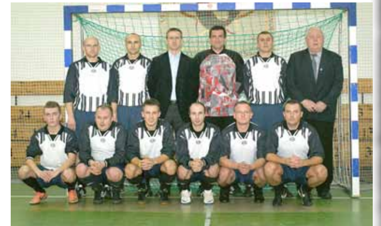
Zwycięska ekipa WS Sieradz. Turniej ukończyli z kompletem punktów i imponującym bilansem goli 11-1