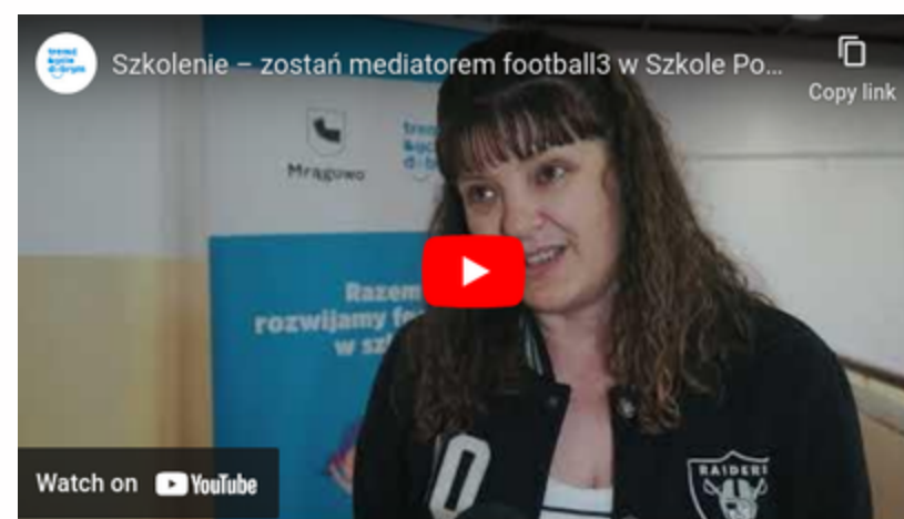
Szkolenie zostać mediatorem football3 Mrągowo 2023 link