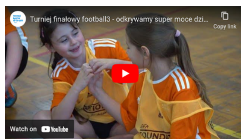
Turniej football3 - odkrywamy super moce dzieci Nowa Góra 2022 link