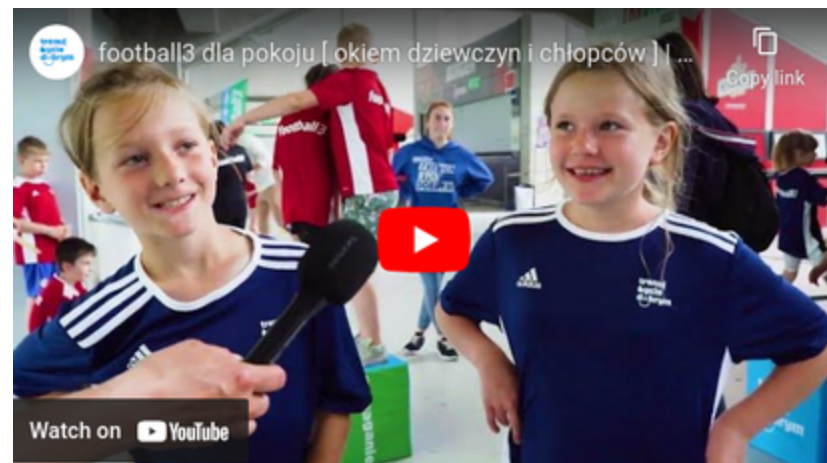
Dzieci o football3 Warszawa 2022 link