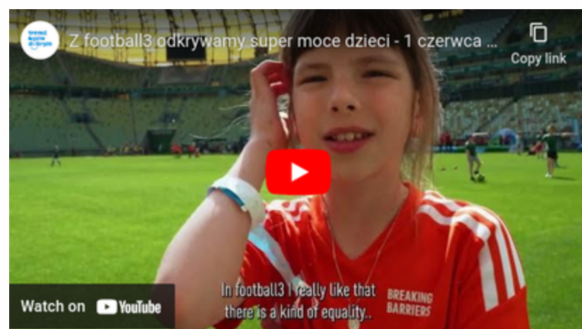
Dzieci o football3 Gdańsk 2023 link