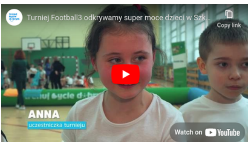
Turniej football3 - odkrywamy super moce dzieci Mrągowo 2023 link