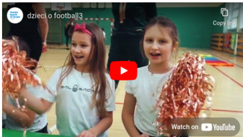
Dzieci o football3