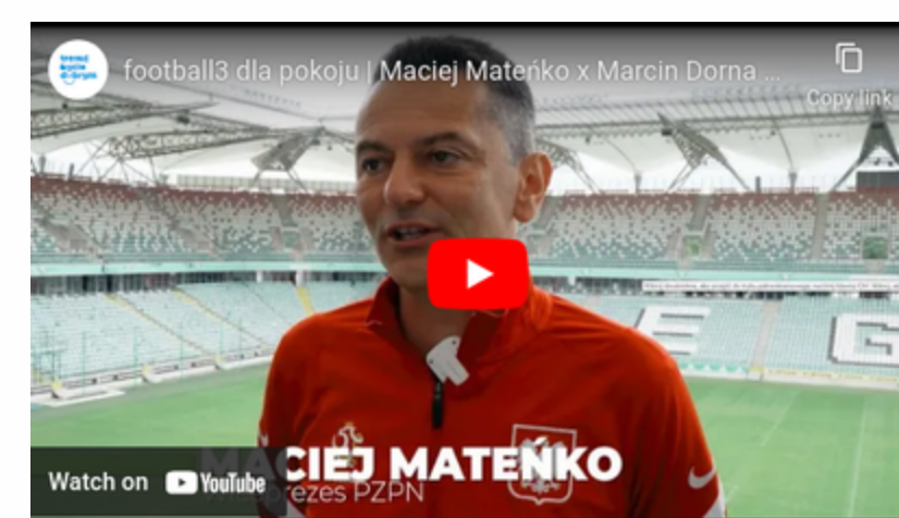
football3 "okiem" ekspertów Warszawa 2022 link