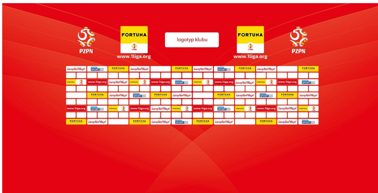
Poglądowa ścianka do sal konferencyjnych na meczach o Mistrzostwo 1. ligi