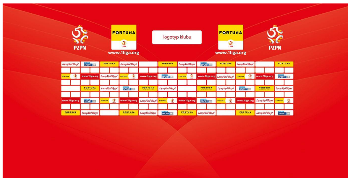
Poglądowa ścianka do sal konferencyjnych na meczach o Mistrzostwo 1. ligi